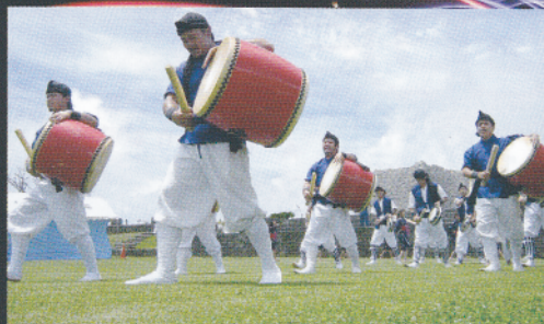
五大グスクエイサー Five groups of Ruin Eisa performance 中城村津覇青年会 / 護佐丸太鼓 / 読谷村渡慶次青年会 / うるま市平敷屋エイサー保存会 / 今帰仁村湧川青年会 / 那覇市松島青年会 / 北中城村島袋青年会 / 北中城村喜舎場青年会

＜注意＞ ※天候や、主催者の都合によりプログラムに変更がある場合がございます。 ※城跡内イベント会場外は有料になります。 ※ペットのご入場はお断り致します。(盲導犬・介助犬を除く) ※飲食持ち込み禁止。会場内の飲食店をご利用下さい。 ※会場内で係員の指示及び注意事項に従わずに生じた事故については、主催者及び会場管理者は一切責任を負いません。 ※会場内での写真撮影及び録画は、他のお客様にご迷惑をおかけしますので、ご遠慮ください。