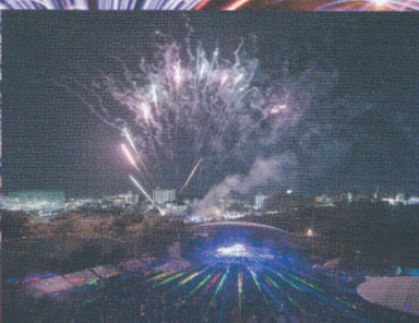
レーザーと打ち上げ花火 Laser show and fireworks レーザーと打ち上げ花火の豪華なコラボレーション