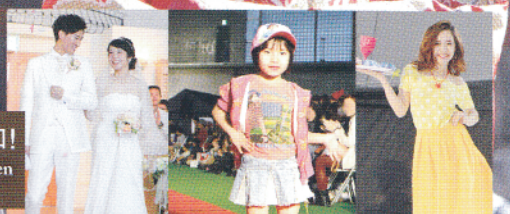
ちゅらガールズコレクション Okinawan girls collection 時裝表演 패션쇼