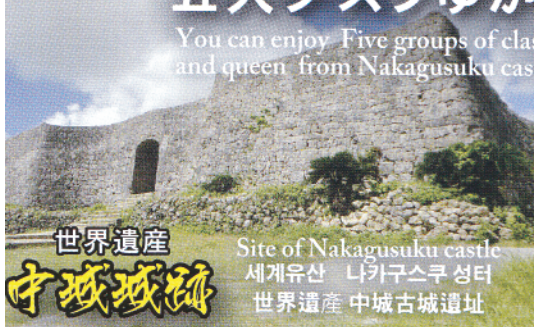
世界遺産 中城城跡

You can enjoy Five groups of classical Ryukyu dance (Eisa), performing featuring king and queen from Nakagusuku castle ruin for approximately 500 years