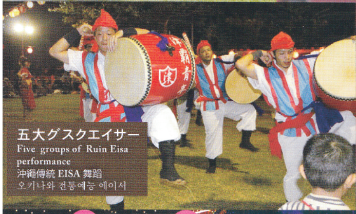
五大グスクエイサー Five groups of Ruin Eisa performance 沖縄傳統 EISA 舞蹈 오키나와 전통예능 에이서