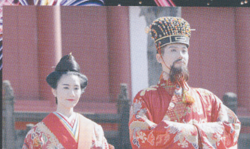
五大グスク王様、王妃が集結! 中城城跡、首里城、勝連城跡、座喜味城跡、今帰仁城跡の王様王妃が一同に集結。