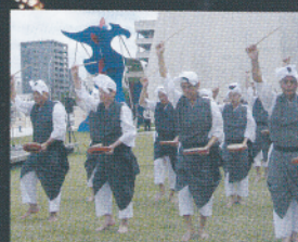
平敷屋エイサー保存会